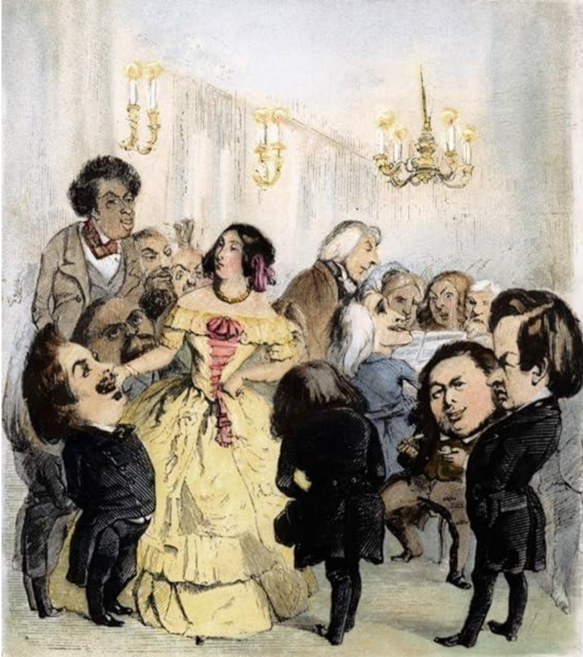
“Té artístico sazonado con grandes hombres”, caricatura de J.-J- Grandville (1846). George Sand rodeada de Eugène Sue, Honoré de Balzac, Franz Liszt, Alexandre Dumas y Victor Hugo.