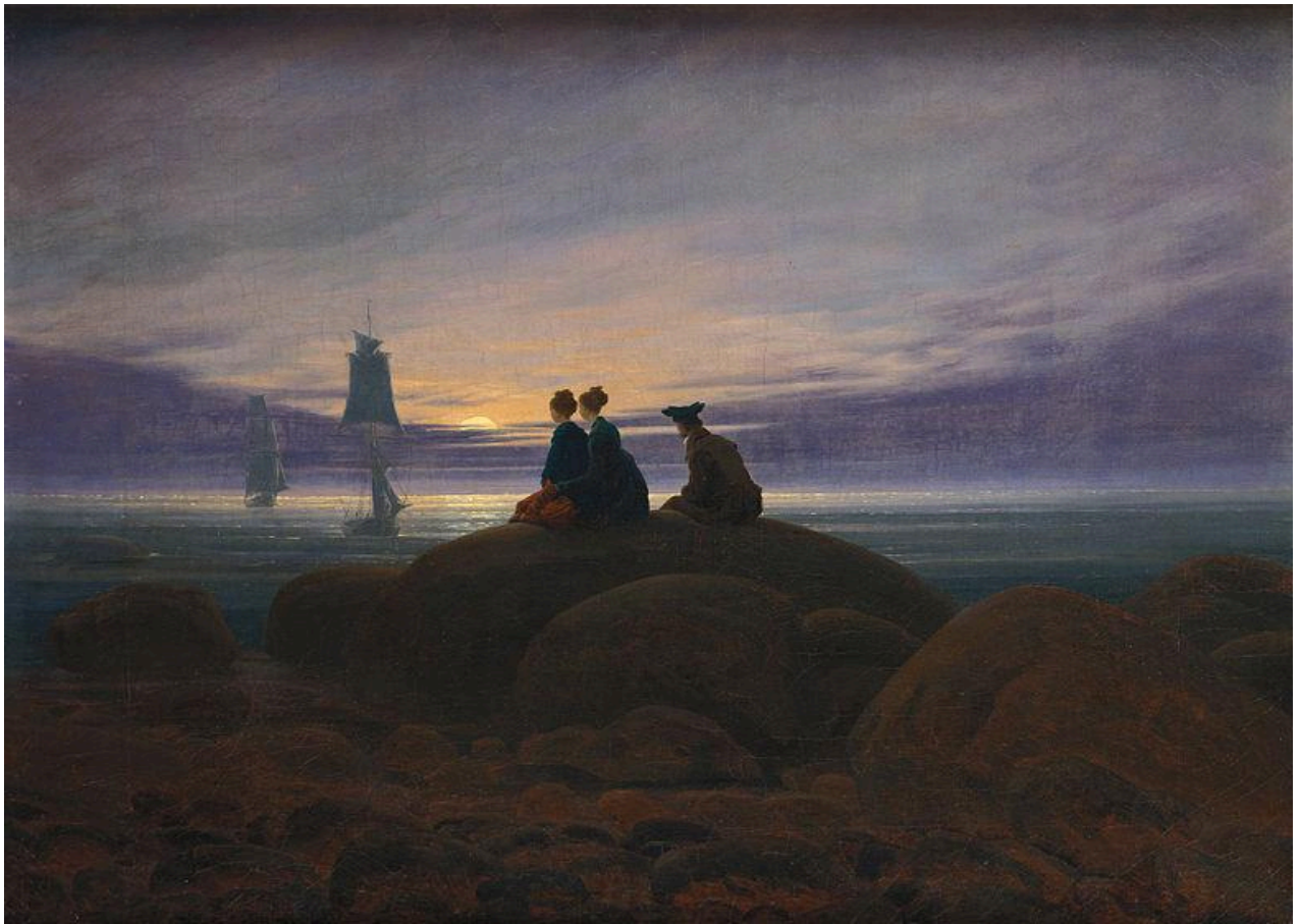
Caspar David Friedrich, Luna saliendo sobre el mar (1822)

Universidad de Buenos Aires FACULTAD DE FILOSOFÍA Y LETRAS